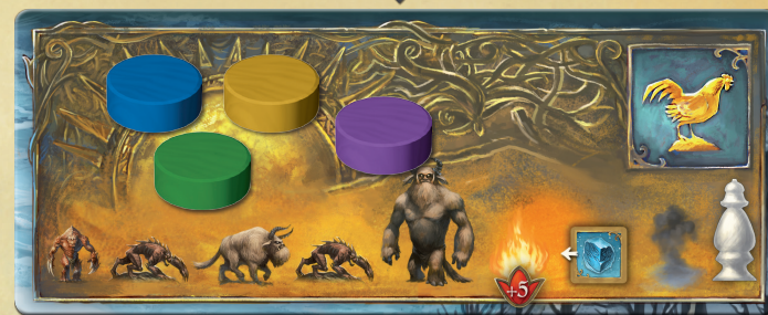
Жетоны времени героев на клетке «Рассвет»