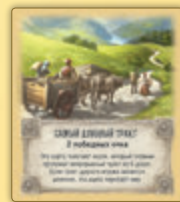
Самый длинный тракт