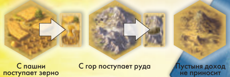
С пашни поступает зерно